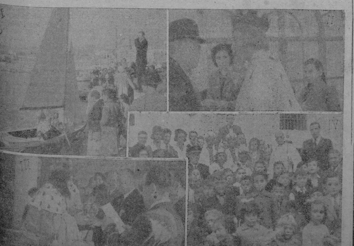
I: La llegada de los Reyes Magos al desembarcadero del Club Náutico, después de la regata en la que participaron: Uno de los Magos es saludado por un dirigente y las pequeñas le observan con expresivo rostro. — III: Durante el reparto de premios en la Fiesta del Club Náutico. — IV: Los Reyes Magos visitaron lo Prisión Provincial donde repartieron juguetes a los hijos de los allí detenidos