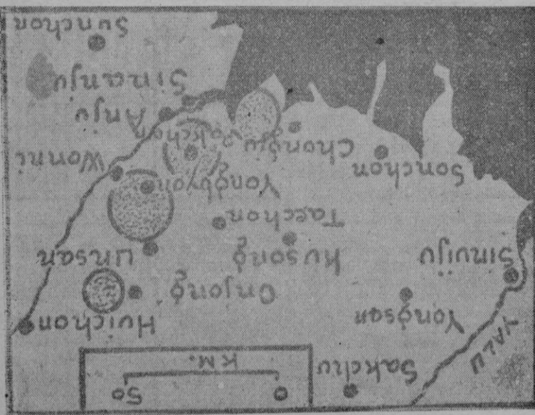
Escenario de la última gran batalla del Norte de Corea

Sin embargo, se ha iniciado ya la primera fase de la última batalla de Corea, que se libra en el frente del río Chongtong, entre Taschon y Paichon, tratando los aliados de abrir el dispositivo comunista a lo largo del ondulado frente