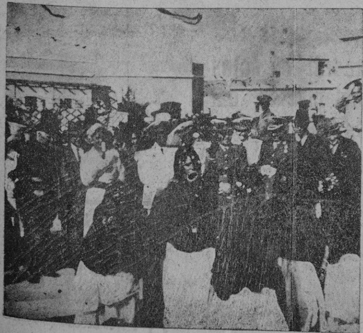
El Añil. — El Jefe del Estado con su esposa y las personalidades que le acompañaban presenciando las danzas de los grupos nómadas.

El valor de España reside en que cuando todo es materia, nosotros nos sentimos espíritu, y cuando todo es descomposición, nosotros nos sentimos unidad. Si mucho le debemos a nuestra gloriosa Cruzada esto es una cosa más; no solo reconquistamos la Patria propia próxima a perderse, sino que hemos rescatado nuestro nombre y nuestro honor, el prestigio de España, que seguirá firme y seguro porque descansa en vuestros pechos y está guardado por vuestras bayonetas. (Grandes aplausos).