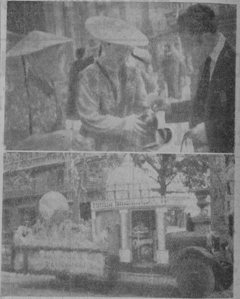
Dos aspectos de la celebración del Domund en Palma. Arriba: dos niños solicitan el óbolo de un turista.—Abajo: Una de las carrozas

Se celebró anteayer en nuestra ciudad, brillantemente, el Domingo Mundial de la Propagación de la Fe que por coincidir con el Año Santo obtuvo un éxito excepcional.