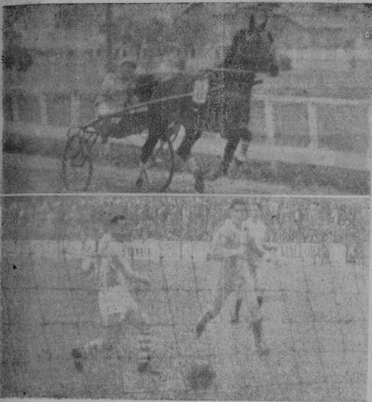
Arriba: Un aspecto de la primera carrera en el Hipódromo. — Abajo: el gol, tan disputado, en San Cugat.