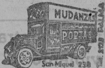
San Miguel 238

FRONTON BALEAR. — Tarde y noche. Partidos y quinielas.