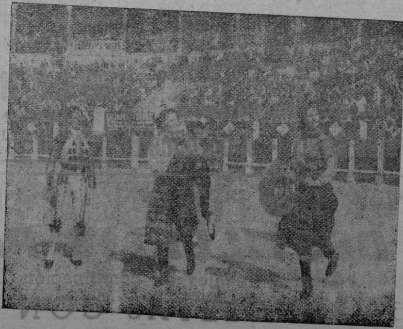
Un momento de ese maravilloso espectáculo

El único espectáculo que llena todas las Plazas de Toros