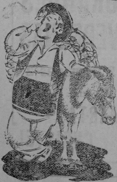
CUANDO HACE CALOR

—¿Su esposa?—pregunta el policía, y cuando el viajero inclina