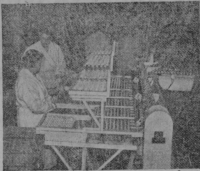
Nueva maquinaria va instalándose en explotaciones avícolas para el calibrado y embalaje de los huevos destinados a los vendedores al por mayor, que los reciben con popurrísimas roturas y ya clasificados por tamaños. (Calpe)