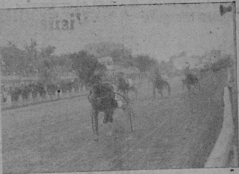
Un momento del Gran Premio Nacional disputado en forma brillante en el Hipódromo de la Real Sociedad Hípica.