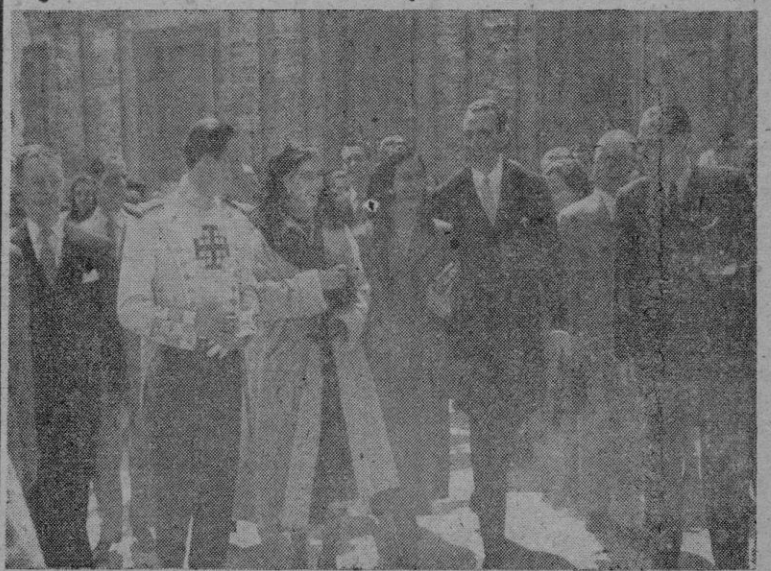
La Excmo. Sra. doña Carmen Polo de Franco y sus hijos los marqueses de Villaverde rodeados de peregrinos en la plaza de San Pedro, después del acto de canonización de San Antonio M.ª Car.

Otro chiste. Este, norteamericano. Un funcionario del Comité de actividades Antinacionales interrogando a una muchacha que estuvo en Rusia. La muchacha se defiende: —Si yo estuve en Rusia. Pero también tengo unos parientes en Italia, y no por eso me va usted a acusar de fascista. También estuve en Berlín, y no por eso me va usted a acusar de nazi. Igualmente pasé un fin de semana en Haití, y no por eso soy negra..