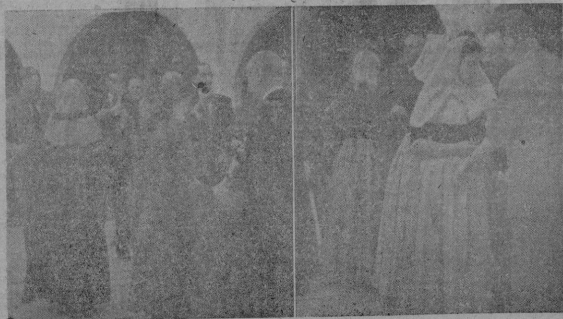
Dos aspectos de la fiesta ofrecida por el Ayuntamiento en el Castillo de Bellver y durante la cual se impuso la Medalla Colectiva de la Ciudad a las muchachas de Coros y Danzas, que tan brillantemente representaron a Mallorca en el viaje triunfal por tierras de América.