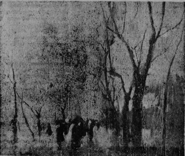
Una de las obras de Lucien Frank

labras de Apelles, al decir que parecían pintados con el alma. Lucien Frank da esta sensación: Pintura mística, emocionada, íntima, llena de delicados matices.