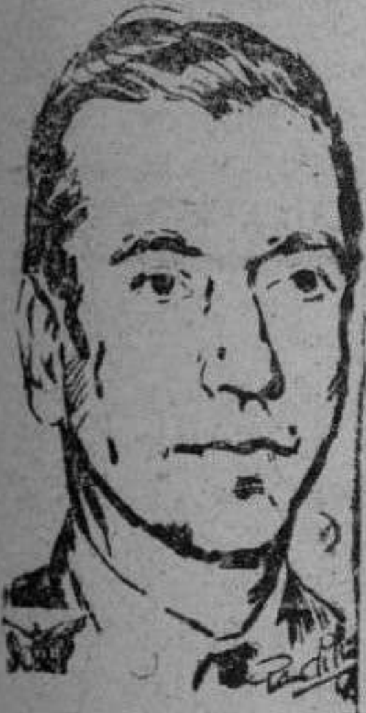
Hipólito J. Paz

Buenos Aires, 28. - El Ministro de Asuntos Exteriores argentino, Hipólito Jesús Paz, después de una larga conferencia con el Presidente, el Ministro de Economía, Roberto Areas, y el de Defensa, Gómez Morales, el Gobierno pedirá a Gran Bretaña una explicación sobre algunas palabras del Ministro de Alimentación inglés, Maurice Webbs, según las cuales la Argentina está practicando un chantaje contra Gran Bretaña en las negociaciones de un nuevo acuerdo comercial.