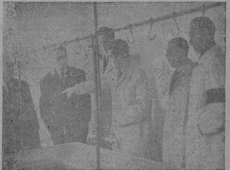
Los concurrentes al acto de inauguración de la ampliación del Matadero de Sóller examinando las nuevas instalaciones construidas con la aportación de Regiones Devastadas