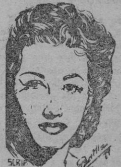
Ivonne de Carlo

Ivonne de Carlo no es la novia del Sha de Persia