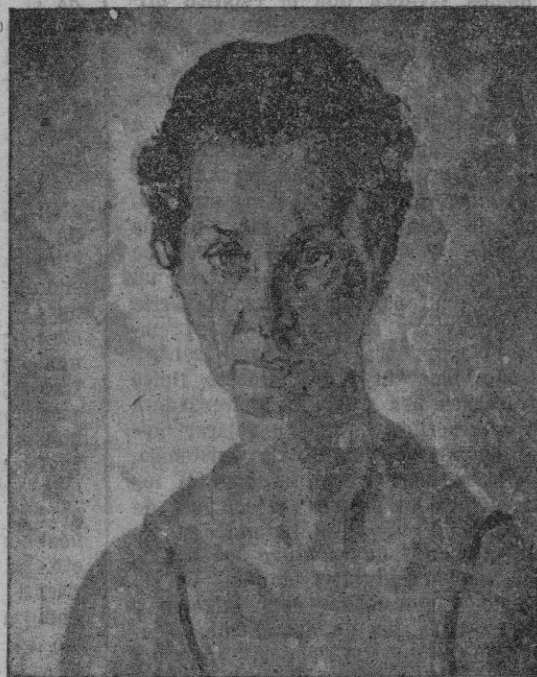
Retrato. - Oleo de Tito Cittadini

Su interpretación de Mallorca, es alegre, grata y esforzada. En la obra de hoy abundan las sutilezas. Ha desaparecido, en