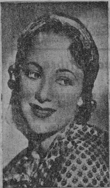
Olivia de Havilland

Interpretación: — La labor que Olivia de Havilland realiza en este film, desde los primeros fotogramas, hasta que abandona el Nosocomio totalmente curada de su dolencia, es tan maravillosa, que no