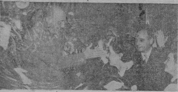
S. E. el Jefe del Estado español y Generalísimo de los Ejércitos don Francisco Franco Bahamonde, acariciando a una niña en la recepción que dispuso a la colonia española de Lisboa en el Palacio de Queluz