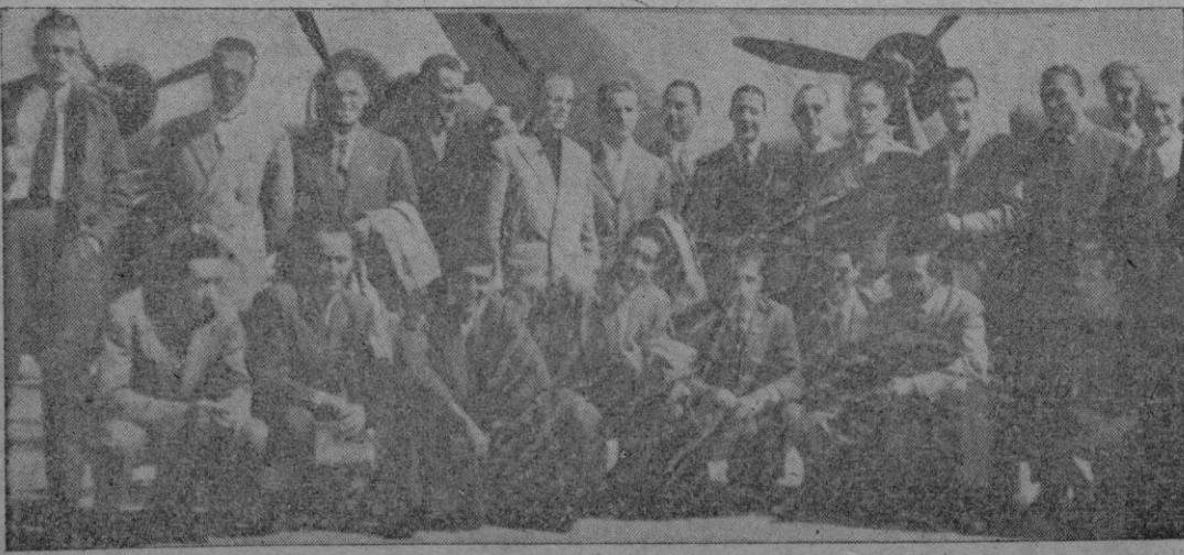
Los componentes del equipo torinés fotografiados junto al avión que les llevó a Lisboa y que a su regreso se estrelló en la trágica forma que ha registrado la crónica de estos días