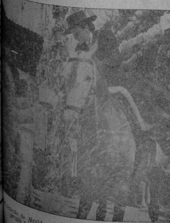
El Alcalde de la capital andaluza, hace entrega del premio a la ganadora del concurso de Amazonas