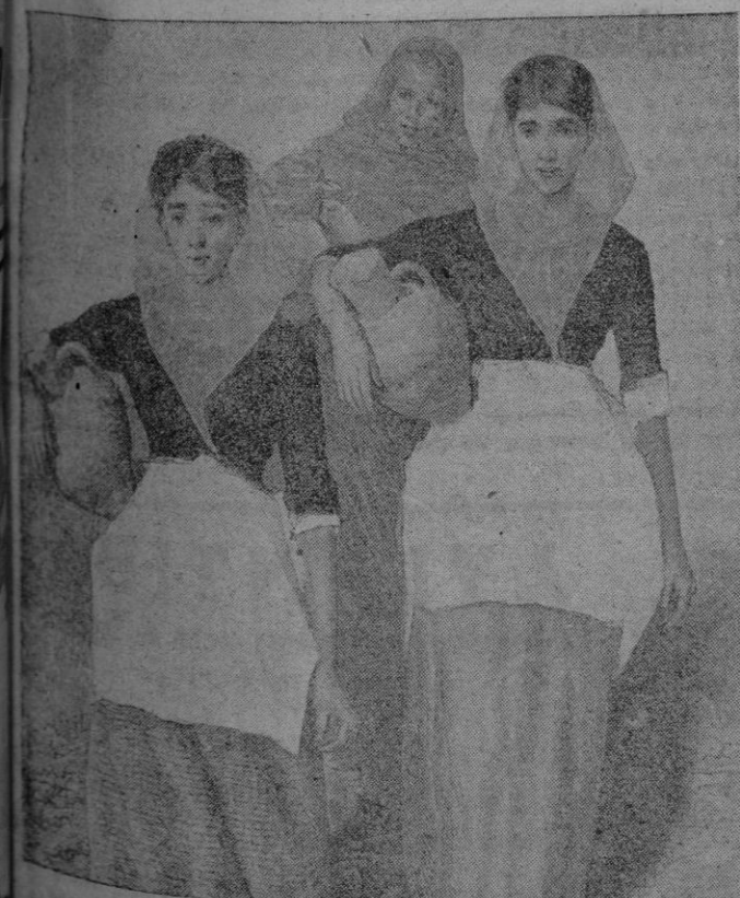
Las canéforas de Pollensa

ros vacíos cuya utilidad fácilmente se explica. De la época medieval son, por consiguiente, esas vasijas. Considerése que desde hace mucho tiempo "gerrer" en mallorquín es lo mismo que alfarero aunque este artesano fabrique además de cántaros, tinajas, bernegales, alcaduces, ladrillos para los pavimentos, barreños, etc. La antigua calle de la "Gerreteria" significa mucho a este propósito. No es el cántaro de barro un objeto que suela durar o conservarse durante mucho tiempo, ya o no a la fuente. Por eso se construían, también, "d'aram" y cobre, habiendo visto ejemplares