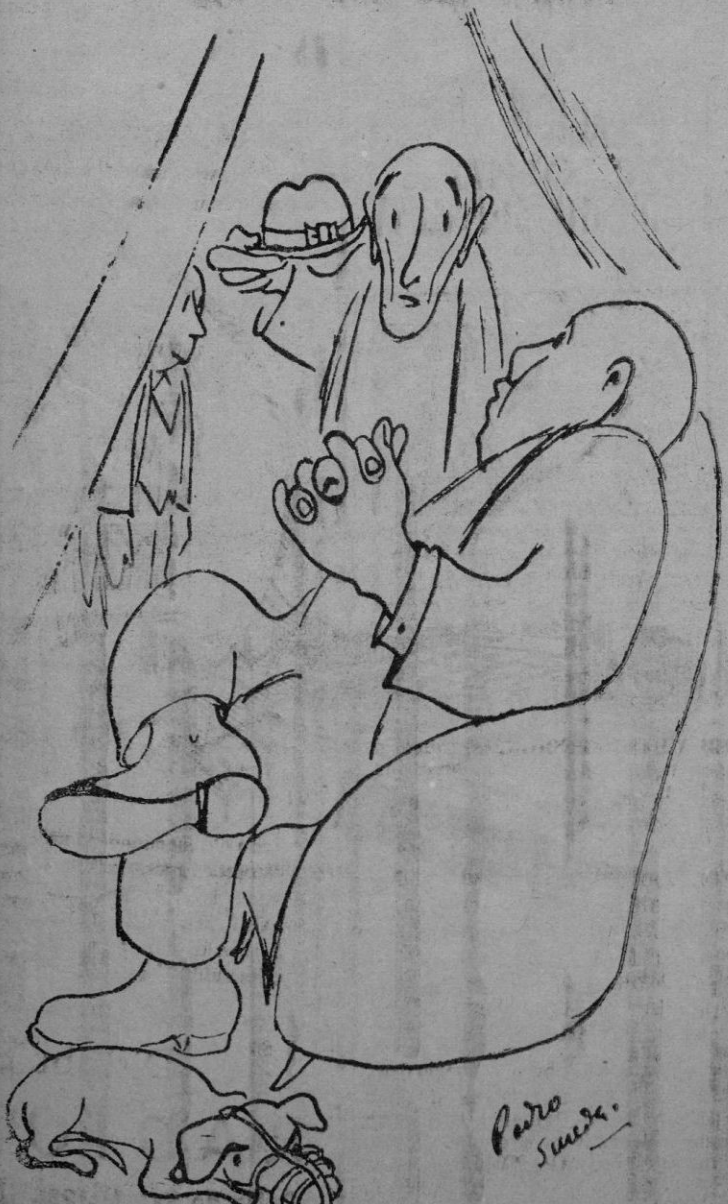
—¿Qué cobra Vd. cada mes? —Gana.