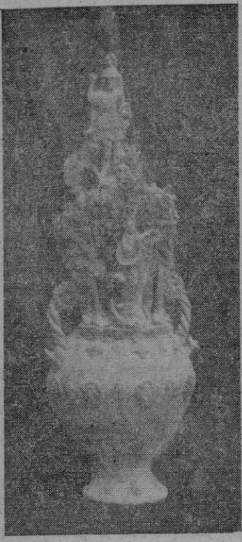
El ejemplar que figuró en la exposición de Porreras