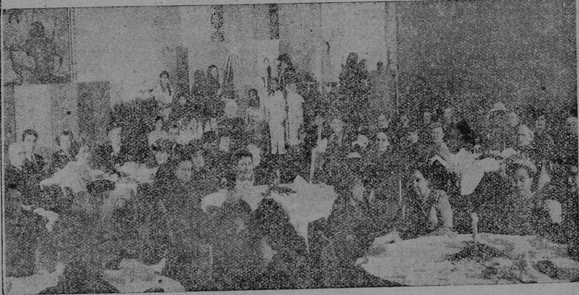
Una de las reuniones en el Circulo Hispano Americano

Sus sentimientos son internacionalistas y su ambición es promover unas florecientes relaciones de amistad entre Mallorca, los Estados Unidos y la Gran Bretaña, patria de su marido.