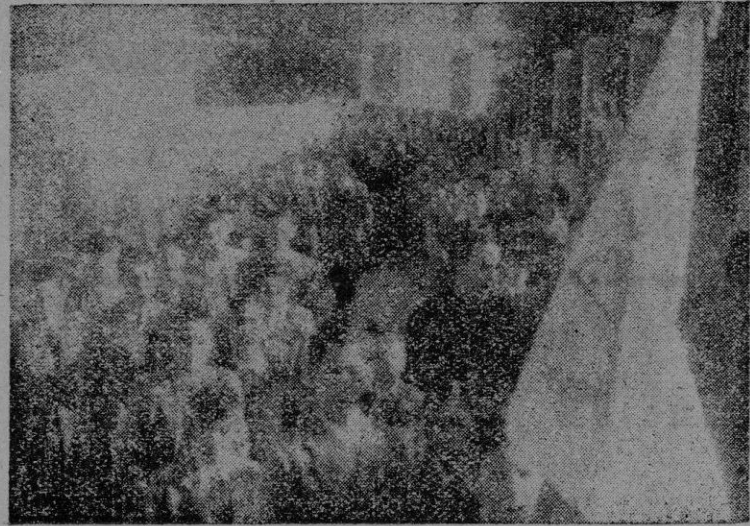
Los aspirantes camino de Bellver