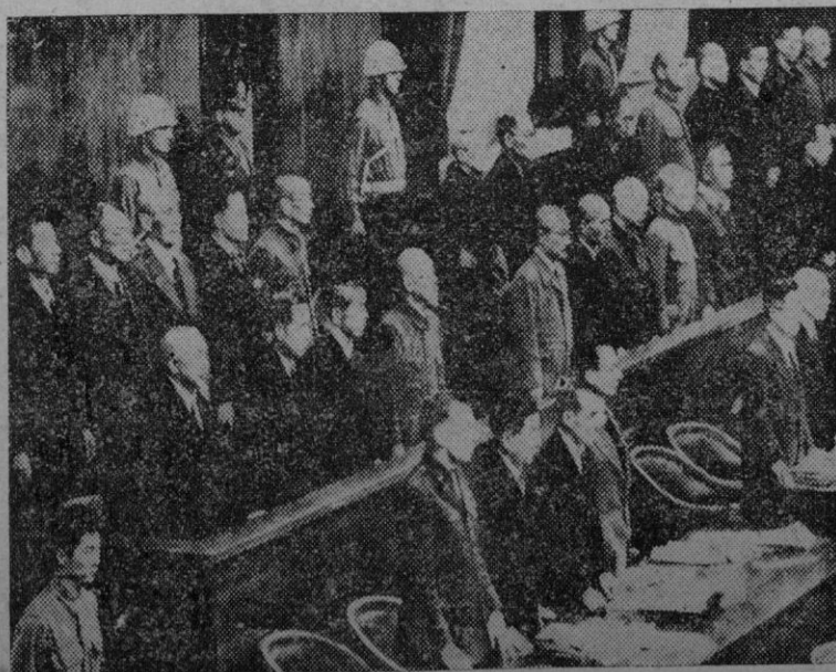
El general Tojo —primero de los del grupo de la derecha— con los restantes procesados, en el momento de la lectura de la sentencia.