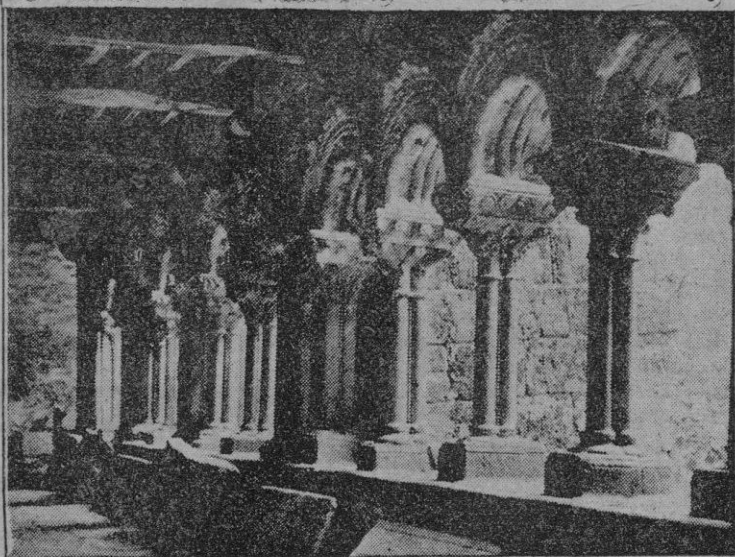
Claustro románico de S. M. del Sar, Santiago

...ante el delicioso viaje por Galicia, una gran parte de la vida y León, aunque bajo visión esquemática, he podido tener impresiones que no son fáciles de olvidar ni despreciar, sobre todo en cuanto al valor de los recorridos e importancia de los monumentos artísticos y arqueológicos admirados, no me olvido respecto de costumbres y condiciones de vida que merecen una referencia para conocimiento del lector que no ha viajado con libros o guías que de estas regiones que históricamente han sido tan personalizadas a un perfil acusado.