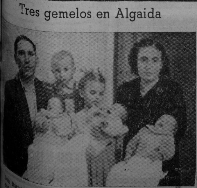
Tres gemelos en Algaida

ELECTOR: Tu voto puede decidir que Palma sea administrada por los más capacitados.