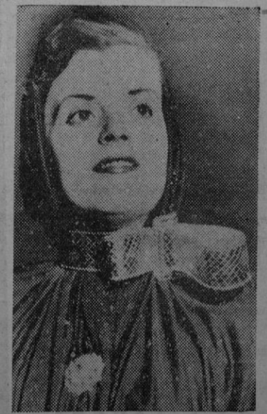
Paris. — El modista Schiaparelli ha lanzado la moda de atar el cinturón al cuello para ciertas ocasiones, como la de la foto que luce un bello cinturón arrollado al cuello que ayuda sujetar el paperuchón