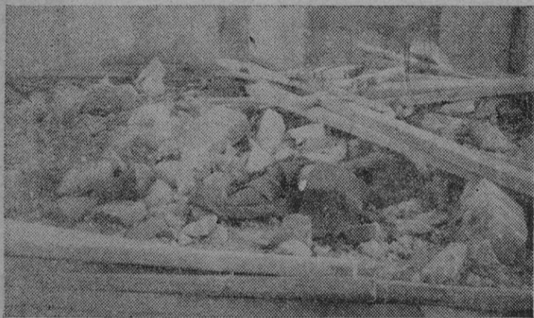
Entre el infructuoso montón de piedras y maderas, se ve el cuerpo inanimado de una de las desgraciadas víctimas, cubierto con un paño