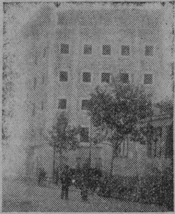
El alero desprendido ocupaba toda la longitud de la fachada lateral marcada en el grabado con dos flechas

Otros obreros que en la finca trabajaban y los vecinos, alarmados por el estrépito que causó el derrumbamiento, acudieron en auxilio de los accidentados, aunque infructuosamente, dando cuenta a