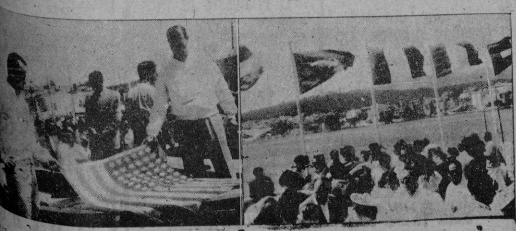
Fuó lugar la bendición y sorteo de las embarcaciones, actos a los que corresponden las dos categorías superiores. En la tercera los participantes de los EE. UU. colocaron la bandera de su país sobre el snipe que les correspondió en suerte y en la última, las enseñas de las naciones participantes flameando al viento en la terraza de Náuico.