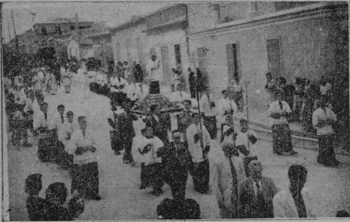
La nueva imagen de San Cayetano, desfilando procesionalmente, por las calles de las barriadas de Son Español y Son Cotoneret

Ayer por la mañana se celebraron las misas rezadas en sufragio de los cofrades difuntos y por la noche después de la velada teatral se quemó la falla que estuvo expuesta durante estos días de fiesta y que se titulaba, "Los adoradores de Baco".