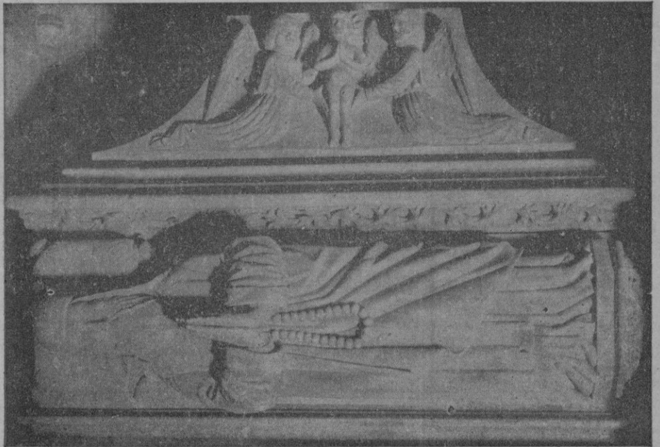
El sepulchro del mártir mallorquín en la Basílica de San Francisco