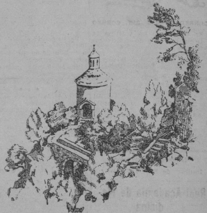
La Rotonda, construida por el Archiduque en los evocados parajes de Miramar, hoy en estado casi ruinoso (Dibujo del malogrado D. Bartolomé Ferrá)

Solo dijo que el general se halla actualmente en el Camerón y que se le ha ordenado que regrese inmediatamente a Francia para ponerse a las órdenes del Ministro de la Guerra.—Efe.