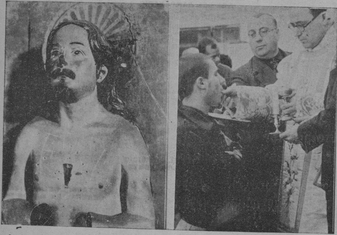
La horda profanó las imágenes como muestra la primera fotografía, y el espíritu cristiano del nuevo Estado dotó a las instituciones penitenciarias españolas del sentido católico de Papas modernos

La caritativa política de Franco ha ido así liquidando el problema penitenciario español. Para resolverlo al mismo tiempo que se acudió a las leyes de libertad condicional, se crearon una serie de instituciones en las cuales los reclusos y sus familias encontraron el apoyo de la generosa política de Franco. Hoy España puede presentar al mundo un régimen penitenciario perfecto, y colocado a la cabeza de los pueblos cultos.