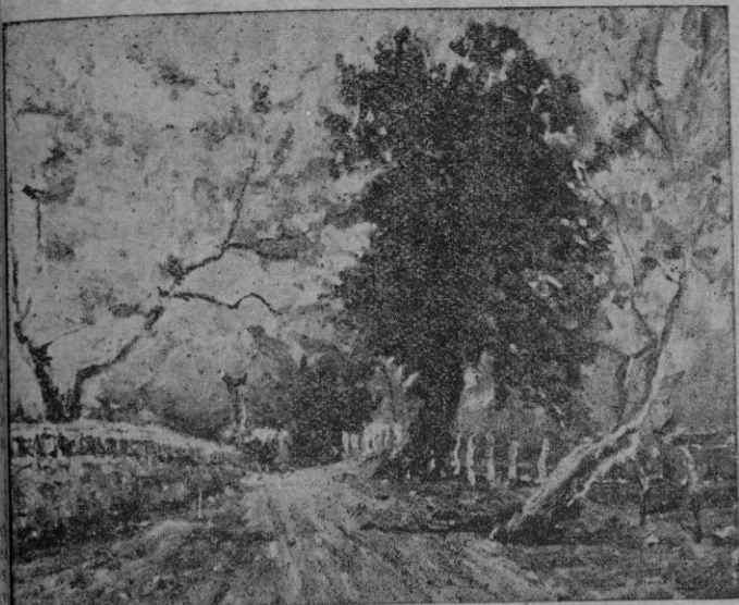
I. Freixas Corrás. — Paisaje