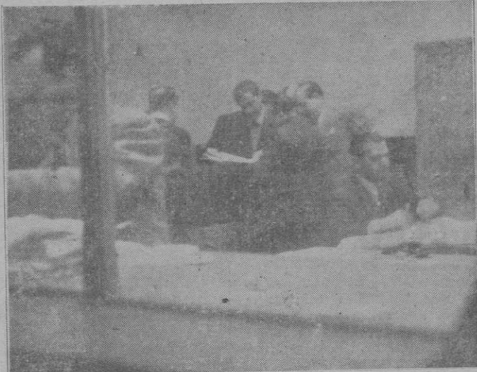
De la visita del Excmo. Sr. Gobernador Civil al Instituto Nacional de Previsión

poco tiempo con Italia y no tardaremos mucho en ver como se da a la publicidad la noticia de que también se han firmado otros dos comercios, con distintos países del Continente. Preguntado sobre el fundamento que tiene el rumor sobre una inmediata modificación de cambio, el Director del Instituto Nacional de Moneda Extranjera contestó con estas palabras: «Como es natural, estos rumores han llegado a nuestro conocimiento incluso antes de haber sido preguntados desde el extranjero. Puedo manifestar, debidamente autorizado, que tales rumores carecen por completo de fundamento.»