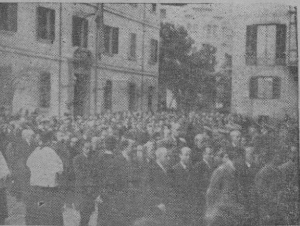
Un aspecto de la gran festación religiosa, que llenaba las calles del trayecto