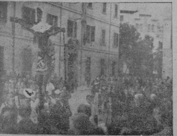
La imagen de la Sangre al llegar a la Catedral (Véase información en pág. 6)