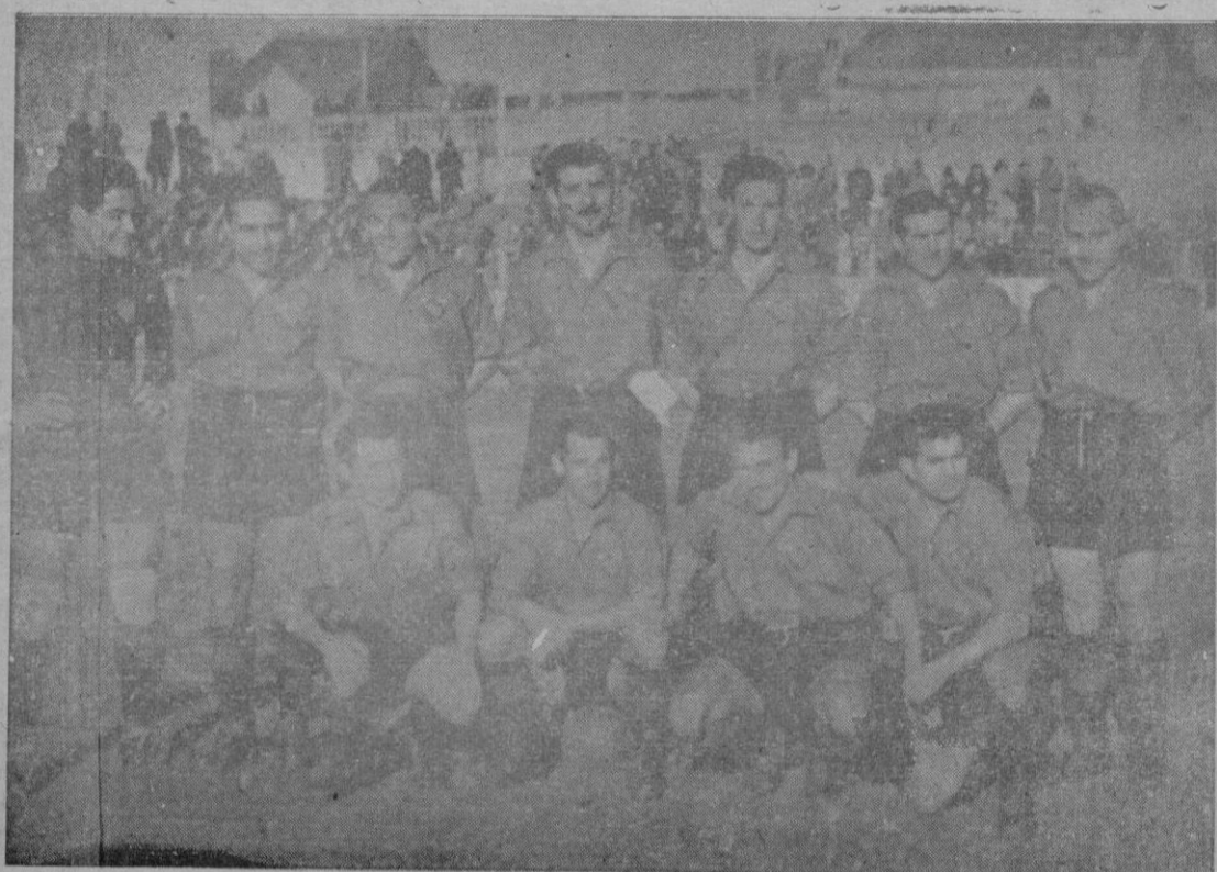
El equipo del Mallorca que anteayer empató en Jerez con el titular y que el próximo domingo recibirá al de la Real Sociedad, celebrando el "Día del Club"