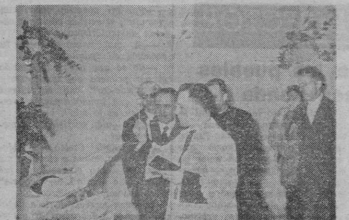
Momento de la bendición de los salones de alta peluquería "Villamor"

El Sr. Villamor y su distinguida esposa atendieron con su natural simpatía y delicadeza a los invitados que fueron obsequiados con un "cocktail" y la fiesta transcurrió dentro de la mayor distinción y simpatía.