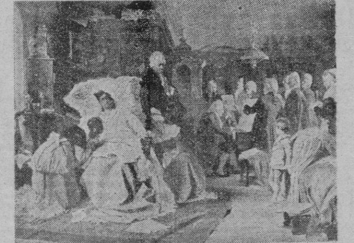
En su agonía, Mozart quiso que los músicos interpretaran ante su lecho de muerte su genial "Requiem"

Los editores de discos franceses, como homenaje a Mozart, han emprendido la grabación íntegra de todas sus obras, estando ya terminada la obra de piano.