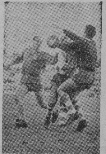
Una situación embarullada ante la meta manacorense, que se resolvió también sin que Sans pudiera conseguir su intento.

Arbitró el señor Martorell que estuvo bien.