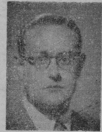
LLOPART DE LA PEÑA

—¿Qué lunares señalarías en la organización de este primer certamen?