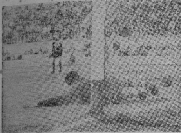
Y así se produjo el segundo gol. El portero se lanzó justamente a la parte contraria donde Sans envió el balón.