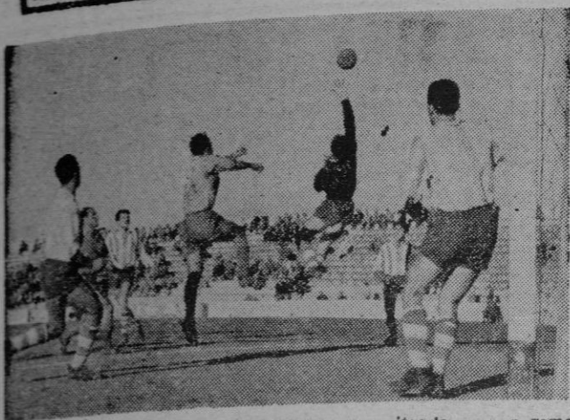
Una buena intervención del meta manacorense evitando que un remate de Sans se colara en la meta.