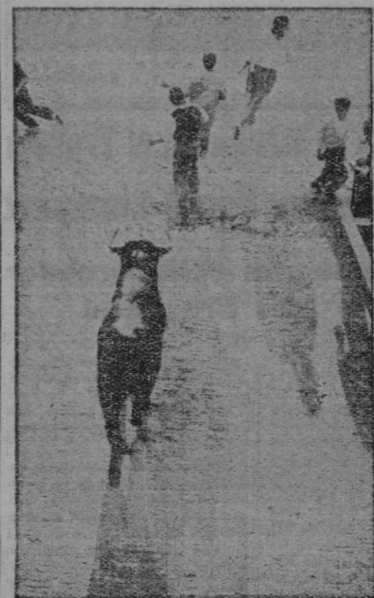
PAMPLONA.—Una vez más se celebró el típico "encierro" de los toros de las corridas con motivo de la Fiesta de San Fermín, en la que los pamplonicos derrocharon, como siempre, valor extraordinario, a través de su carrera por las calles hasta la Plaza. La foto muestra un momento del típico "encierro"

PAMPLONA, 10. Cuarta corrida de Feria. Seis toros de don Juan Cobaleda. Tarde ventosa y fría. Los toros de bonita lamina han dado buen juego.