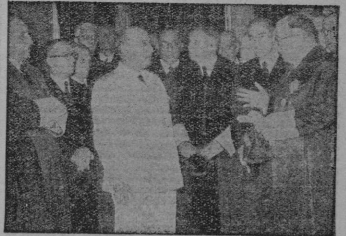
MADRID.—Su Excelencia el Jefe del Estado recibió en audiencia en el Palacio de El Pardo al Consejo General de los Ilustres Colegios de Abogados de España y todos los decanos, presididos por el ministro de Justicia señor Iturrumendi.

5.157.232.500 dólares en la ayuda al exterior