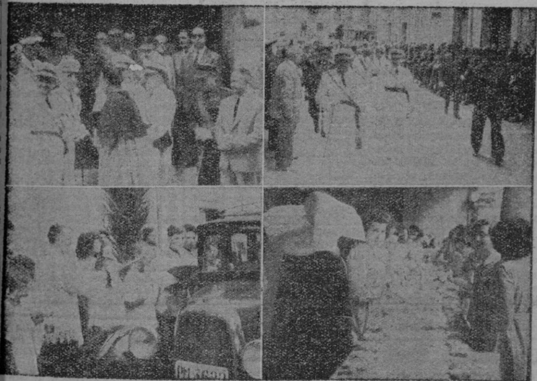
DIVERSOS MOMENTOS DE LOS ACTOS MILITARES Y RELIGIOSOS, CELEBRADOS AYER EN NUESTRA CIUDAD CON MOTIVO DE LA FESTIVIDAD DE SAN CRISTOBAL, DE LOS QUE DAMOS MAS AMPLIA RESERVA EN EL INTERIOR.