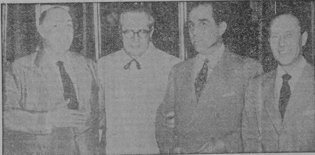
GRANADA.—El guitarrista Andrés Segovia, segundo por la izquierda, y varios solistas que participan en el II Festival de Danza y Música, en el museo de la capilla real durante la solemne visita a la cripta de los Reyes Católicos.

INAUGURACION DEL II FESTIVAL DE DANZA Y MUSICA EN GRANADA