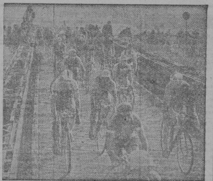
Estampa clásica del "Tour".

La idea de organizar una vuelta a Francia no fué, sin embargo, de Henri Desgrange. A la sazón redactor-jefe de "L'Auto", sino de un redactor deportivo que trabajaba a sus órdenes. Se había corrido entonces la prueba Marsella-Paris y Desgrange acogió con calor la iniciativa de su compañero de tarea. En el albergue de Réveille-Marin el fabuloso periodista francés, rodeado de colaboradores, dió comienzo a su tarea. Meses después estaba ya el trabajo listo y los corredores preparados.