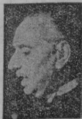
JOSE M. PEMAN

Por JOSE MARIA PEMAN (De la Real Academia Española)