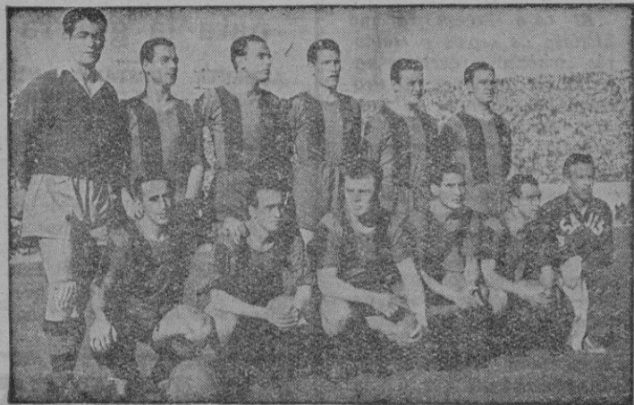
EL C. DE F. BARCELONA