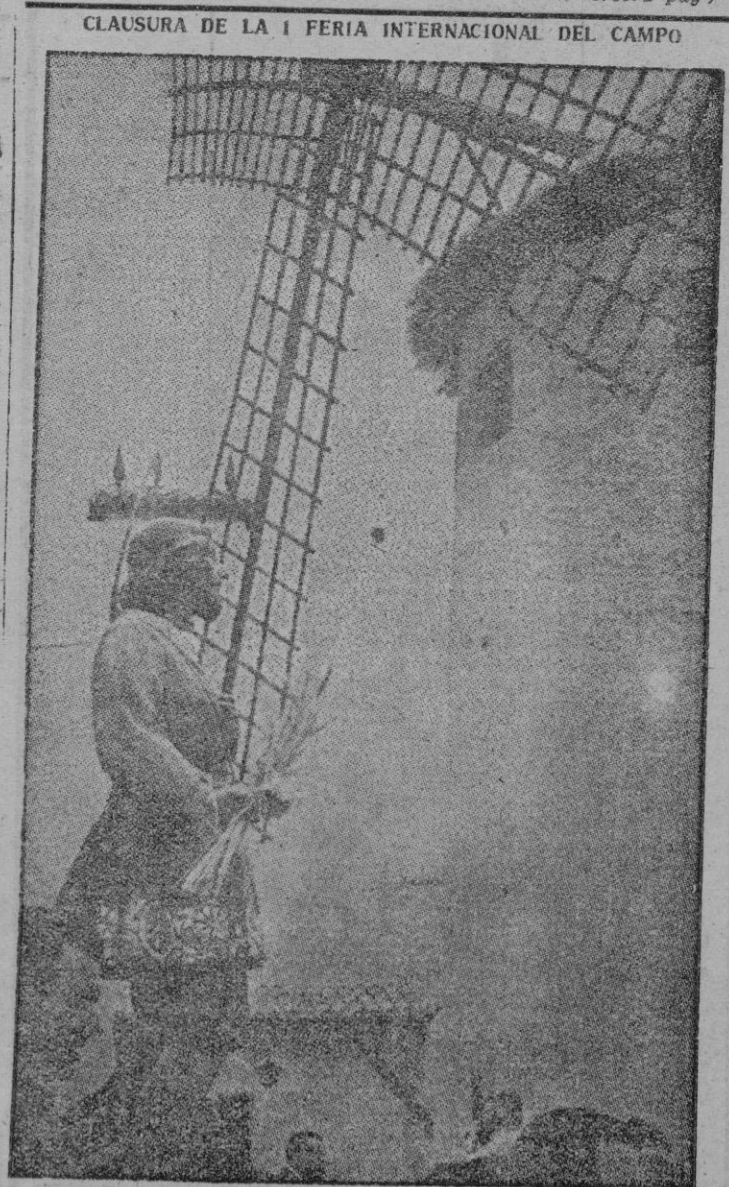
MADRID.—Se efectuó la clausura de la I Feria Internacional del Campo, que tanto éxito ha obtenido durante el tiempo que permaneció abierta al público. Con tal motivo se celebraron diversos actos. La fotografía recoge un momento de la procesión, presidida por la imagen de San Isidro, que se dirigió al altozano del recinto. Se dio la particularidad de que la venerada imagen hizo el recorrido en un “jeep”. Es éste un dato curioso, ya que contrastó la tradición procesional con la innovación realizada.