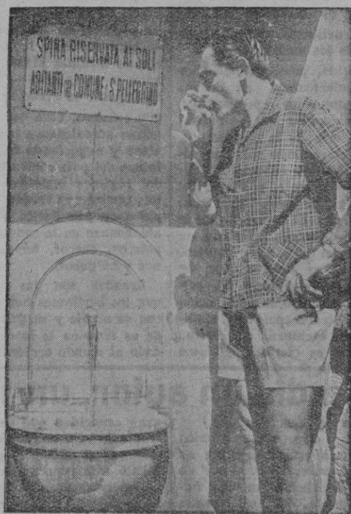
Roma.—Fausto Coppi, el «campeonissimo» italiano, ha sido designado «jefe» del equipo que en representación de su país acude a la Vuelta a Francia. En la presente «foto», Coppi se refresca en una fuente del pueblo de San Pellegriano, después de uno de sus entrenamientos con vistas al «Tour»