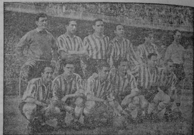
EL ATLETICO DE BILBAO

Hoy, en Madrid, una final histórica, un Atco. de Bilbao-Barcelona con los Zarra y Kubala frente a frente. ¡Qué feliz mortal el que la pueda presenciar!