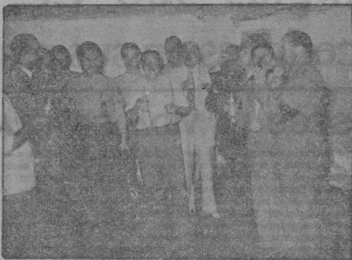
Durante la celebración del precintaje de las motos el sábado pasado, todos los motoristas y directivos fueron obsequiados por BALEARES con productos Lactel, "Iaccas" y "Iacifruit", que degustaron con agrado