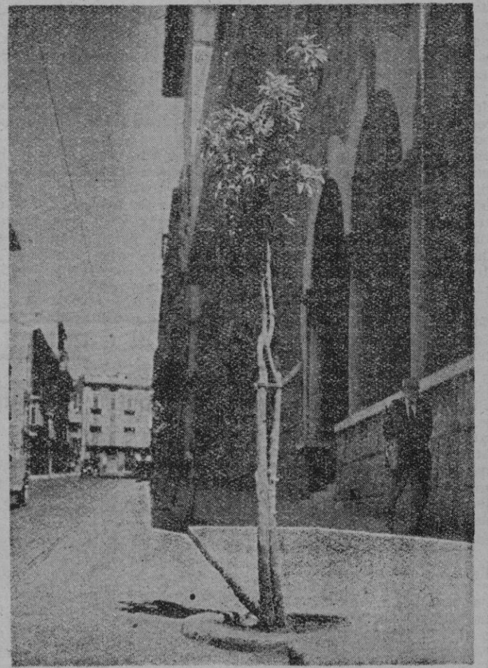
Tiernos árboles frutales que un día sombrearán los peatones mortales que nunca nos faltarán.

Porque estos se conservan tomando cafeaspirina; en cambio ellos reservan el pulgón que los domina.