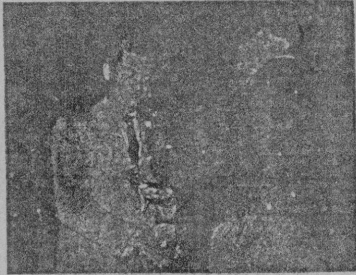
El homenajeado recibiendo uno de los regalos.

En tercera categoría Aguilas venció al La Salle por cincuenta y uno a veinte y siete.