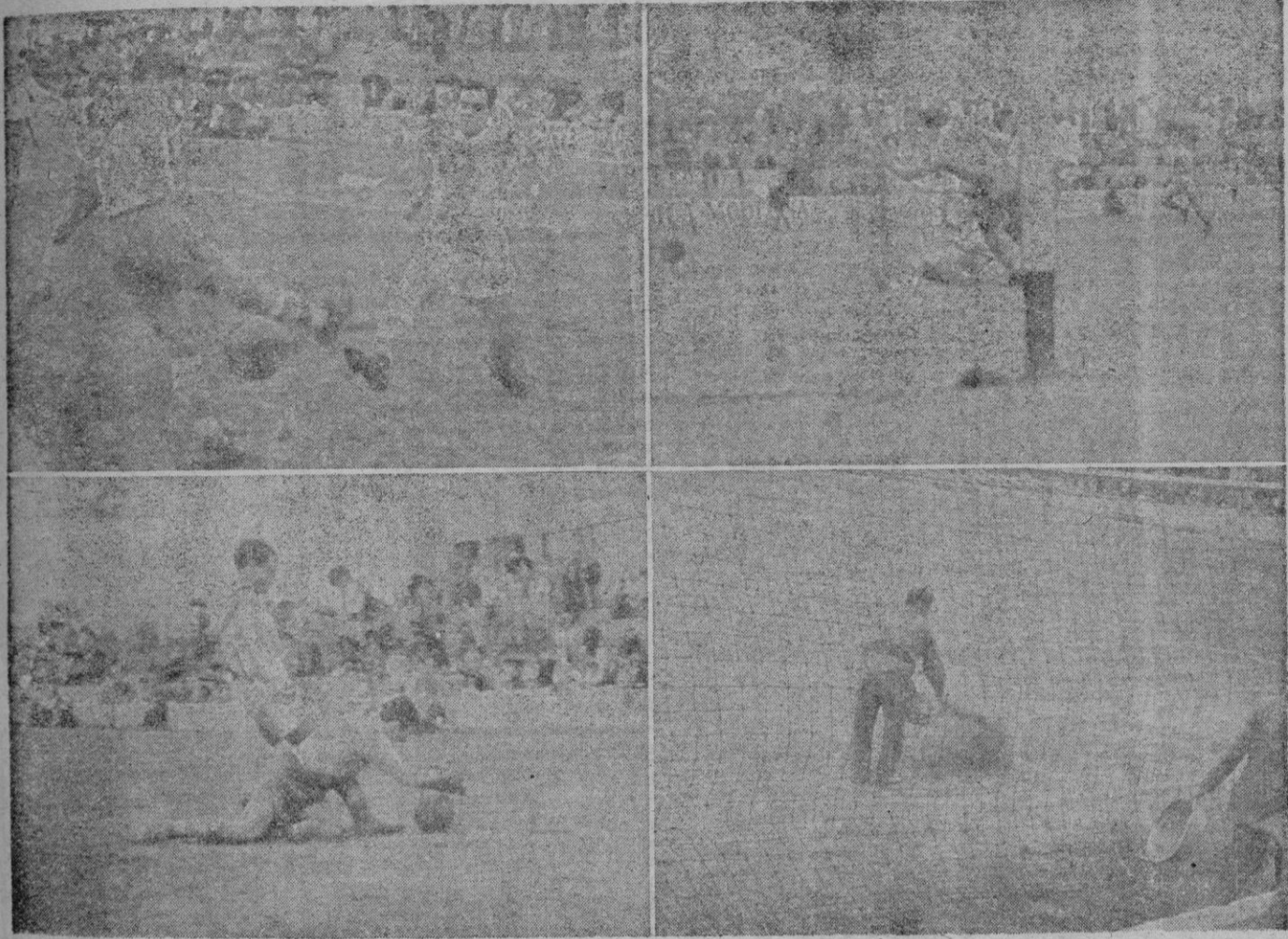
Dos "intentos" de Lalo de hacerse con el balón, en ambas "fotos" se podía precisar como el delantero blanquiazul entraba "con los ojos cerrados". En la otra "foto", Brondo, desde el suelo, remata el centro de Lalo que debía convertirse en el tercer tanto para su equipo. Y finalmente los servicios auxiliares del campo, lanzando arena en el barrizal que se formó delante de ambas porterías.

El "Alcoyano" fué el equipo que nunca se entrega