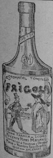
LICOR DE ALTA CALIDAD

Secretaría de cocina dividida en cuatro partes según las épocas de año. Recetas para cada día del mes según los productos de cada época. Libro de Cocina de la Sección Femenina.