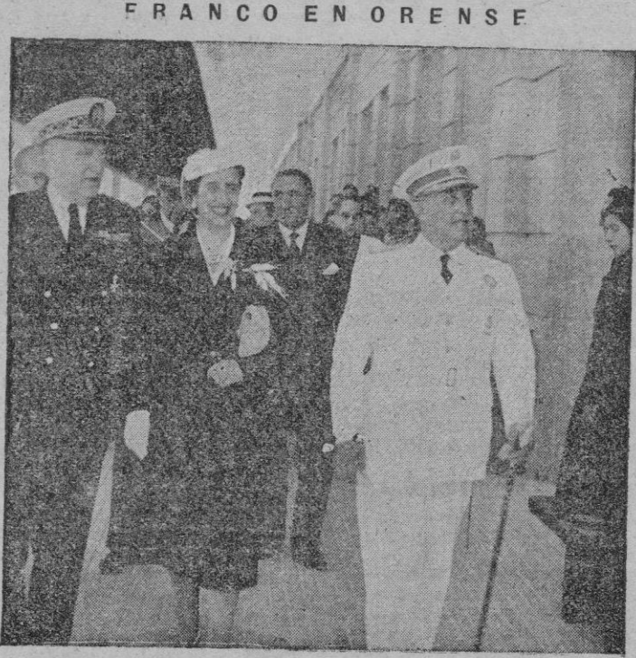
RENSE. — S. E. el Jefe del Estado acompañado de su esposa, S. del Ministro de Obras Públicas y otras personalidades, durante su visita a la nueva estación ferroviaria, que momentos antes fue bendecida por el Obispo de Santiago.

WASHINGTON, 26. — La Oficina de Prensa de la Embajada de España ha hecho circular entre los miembros del Congreso, hombres de negocios, y empresas bancarias periódicos y bibliotecas, una nota sobre el hecho de que España ya se ha adelantado en el pago de su deuda a la International Telephone and Telegraph Company. La nota es reproducción exacta de una noticia publicada por el "New York Times" y a ella la citada Oficina de prensa agrega: "España cumple sus deudas internacionales mucho antes de su vencimiento". — (Efe).