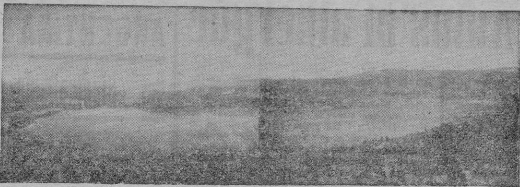
PUENSA DE SANABRIA. —Este gran lago, con la línea férrea que acaba de ser inaugurada, se pone al alcance de infinidad de viajeros procedentes de Madrid. Tiene 5 kms. de largo, 1.600 de ancho en la parte más estrecha y 85 metros de profundidad. Es altamente trucher y la sierra que le circunda se cubre de nieve durante el invierno, haciéndolo ideal para toda clase de deportes. (Foto CIFRA Gráfica).

Agregó que el gobierno francés siempre ha observado "la más es- tricta lealtad con respecto a sus aliados, Estados Unidos y Gran Bretaña".—Etc.