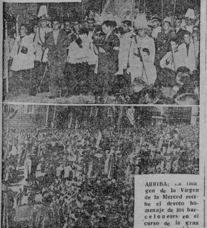
ARRIBA: La imagen de la Virgen de la Merced recibe el devoto homenaje de los barceloneses en el curso de la gran procesión celebrada en la Plaza de San Jaime durante la brillante y pintoresca concentración folklorica.