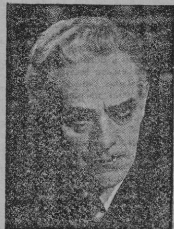
Boris Karloff en una escena del film

Aquí tenemos, como si el tiempo no pasara por él, al monstruo más monstruo de cuantos el cine ha inventado, a Boris Karloff, que se resiste a desaparecer.