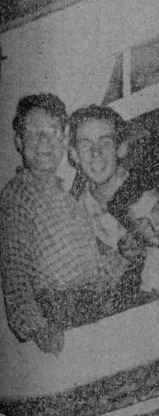
TALDEN (Suiza). — Los cuatro espeleólogos que lograron salir por los medios de la famosa Cueva del Infierno, sonríen satisfechos desde la ventana del hotel donde hicieron su primera comida después de cuatro días de angustia encerrados en la Cueva del Infierno

Trieste, 28. — Según comunican desde Belgrado el recién llegado encargado de Negocios del Japón, Keishi Nakamura ha visitado al ministro interino de Asuntos Exteriores yugoeslavo, Veljko Vranovitch.—Efe.