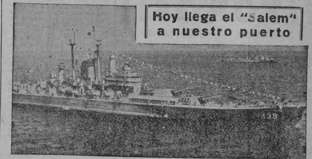
Hoy llega el "Salem" a nuestro puerto