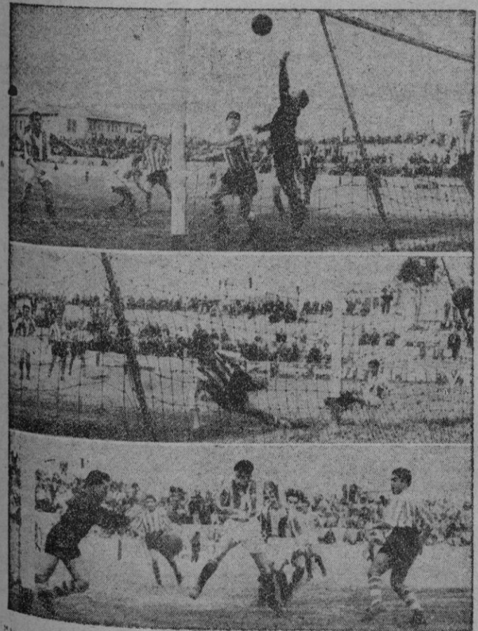
"Juanet" consiguió el domingo captar estos tres momentos interesantes del encuentro Alavés-Atco, Baleares. En ellos puede apreciarse la forma en que fueron logrados los tres goles del equipo blanquiazul

"Rusa", es otro ejemplo de constancia que de día en día va progresando como lo demuestran sus promedios pero, a la hija de "Rango" le falta suerte. "Romero", bastante irregular, lo mismo que "Silva III" y "Sonaje". (Continúa en la siguiente página.)