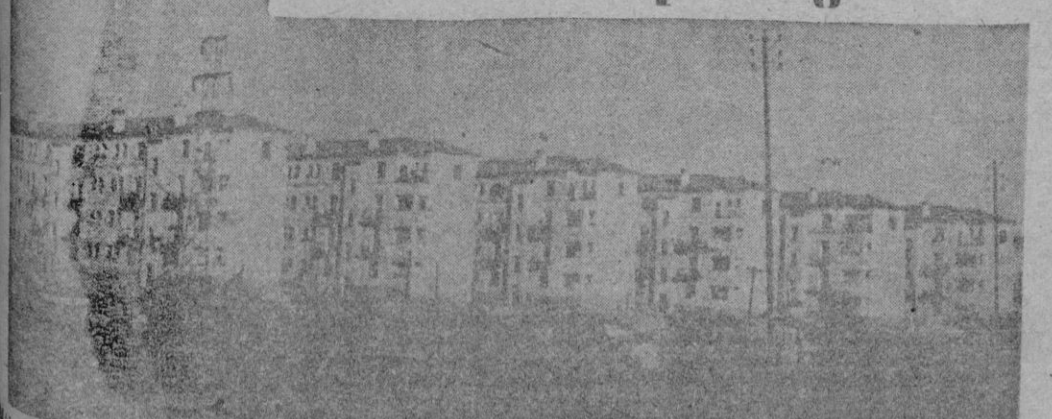
Vista parcial de las viviendas protegidas de Haza de Cuevas en la barriada que lleva el nombre de "José Luis de Arrese".