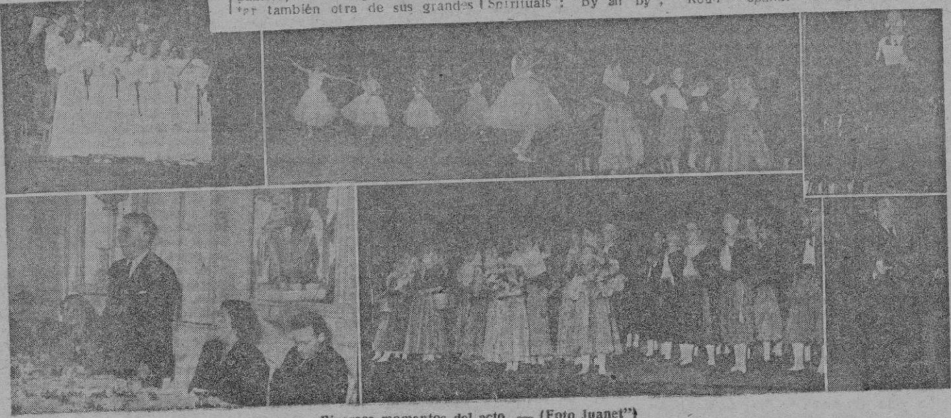
Diversos momentos del acto.

«Mandoos abrazo espiritualmente unido vosotros desde estas lejanas tierras que con tanto éxito hicisteis vibrar con vuestro música y vuestros bailes que hablan de la vieja civilización y suavidad de las tierras mallorquinas orgullo de España.»—Conde de Casa Miranda,