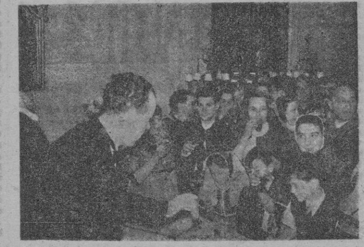
Los muchachos brindan por España en el local de nuestra Embajada de España. En primer término, el hijo del Embajador