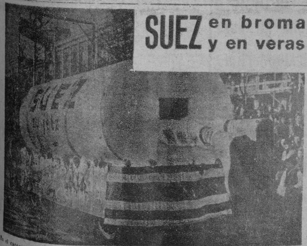
En el carnaval de Munich, a Inglaterra se la ha hecho pasar por el estrecho tubo de Suez. La carroza, de ultramoderno ambiente, es una alegoría bien intencionada y de fácil aplauso popular