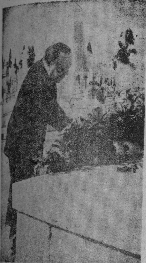
Valencia. — Con motivo de la estancia en esta ciudad del Ministro Secretario General del Movimiento, don Ramundo Fernández Cuesta, para presidir la conmemoración de la unión de la Falange con las I. O. N. S., depositó una corona de flores ante la tumba de Onésimo Redondo, instante que recoge la fotografía.

Fernández Cuesta deposita una corona de flores ante la tumba de ONESIMO REDONDO