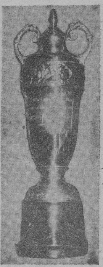
Este es el magnífico trofeo donado por el Ayuntamiento de Muro para premiar al primer clasificado en la carrera del día 19.