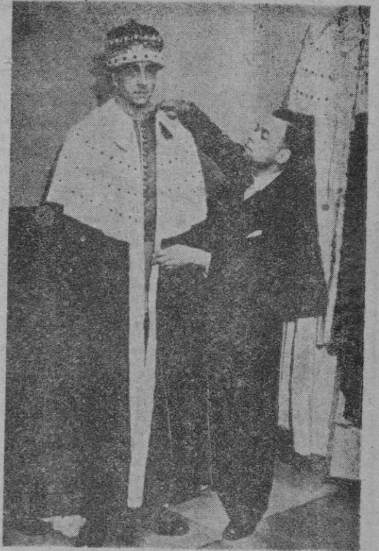
Londres. — Un sastre especializado de esa capital trabaja ya en los preparativos para la Coronación de Isabel II de Inglaterra. En la foto se le ve trabajando sobre un manto de Vizconde que cuesta 1.250 libras.

La nobleza británica preparada para la ceremonia de la coronación