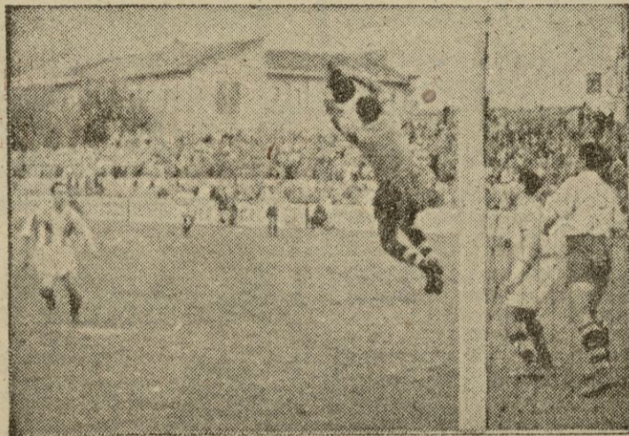
Otra buena parada del portero visitante evita un remate de Olive, que estaba a punto para disparar.