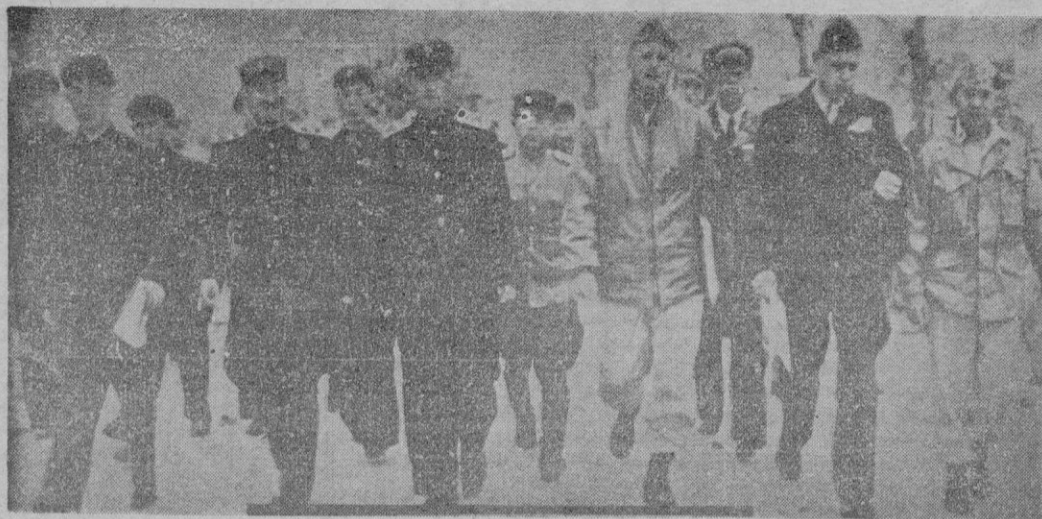
Negociadores de las Naciones Unidas y comunistas se dirigen al puente de Panmunjom, en Corea, para inspeccionar el lugar de las nuevas conversaciones de paz que se han propuesto.

REDACCION: DANUC. 4 Redacción: 2078 Administración: 1745 Sábado, 20 Octubre de 1951 PALMA DE MAYORCA Año XIII - : - Número 3.717 PRECIO: 70 CENTIMOS Suscripción mensual: 12 pesetas