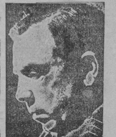
J. B. PRIESTLEY

La novela está repleta de simpatía y el lector se entrega, bien confiando al amor del autor por el mundo — a veces pintoresco siempre humano — de sus personajes y sus vidas.