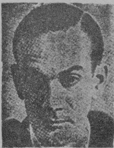
CAMILO JOSE CELA

A Miss Eveline, lo mejor que pudo sucederle fué morir a tiempo. En eso demostró ser una chica inteligente, mucho más, desde luego, que cuando se casó. El "contigo, pan y cebolla", siendo falso, lo es mucho menos que el "contigo, asma y cálculos en la vejiga". Lo malo es — o lo bueno, según