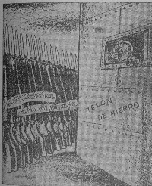
El "telón de acero" la mejor defensa de Europa

La gran realidad de los padecimientos ajenos se hace carne, y cuerpo, y alma, en el propio sufrir. Solo entonces se reconocen los yerros y se eleva la vista del mundo materializado y deshecho, pleno de incomprendiones.