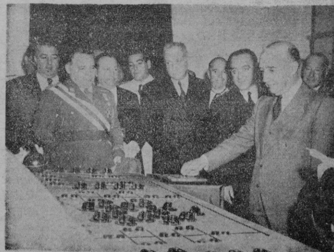
Córdoba. — S. E. el Jefe del Estado, acompañado de las personalidades de su séquito, durante su visita al primer silo del Servicio Nacional del Trigo, que fué inaugurado por S. E.