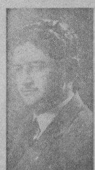
A. DE C.