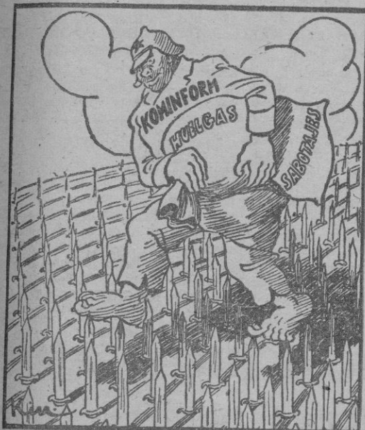
HAY BAYONETAS, Y BAYONETAS

Y como el invierno está metido en temporal diplomático, desde París se envía un informe al Kremlin, entregado en Moscú anoche por el Embajador gallo en la capital moscovita, repudiando, es lógico, la violación. Mientras se siga caminando tan a espaldas de la realidad, ¿es posible hallar la paz sin acuerdo previo, sin comprensión? Y si esto es cierto, ¿dónde está nuestro pesimismo?