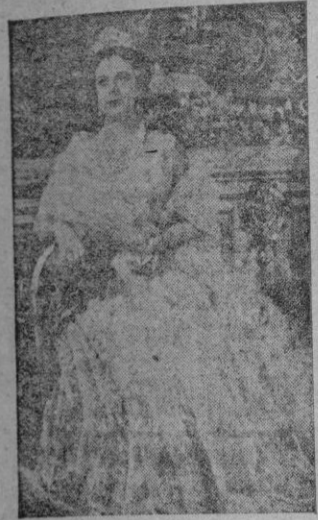
D.ª Carmen Polo de Franco

Roma 4. — (Del enviado especial de la Agencia EFE). — Doña Carmen Polo de Franco, esposa de S. E. el Jefe del Estado español, ha llegado a Roma procedente de Madrid, acompañada de sus hijos los marqueses de Villaverde, para efectuar las visitas jubilaes del Año Santo y asistirá a la ceremonia de canonización del venerable Padre Claret.