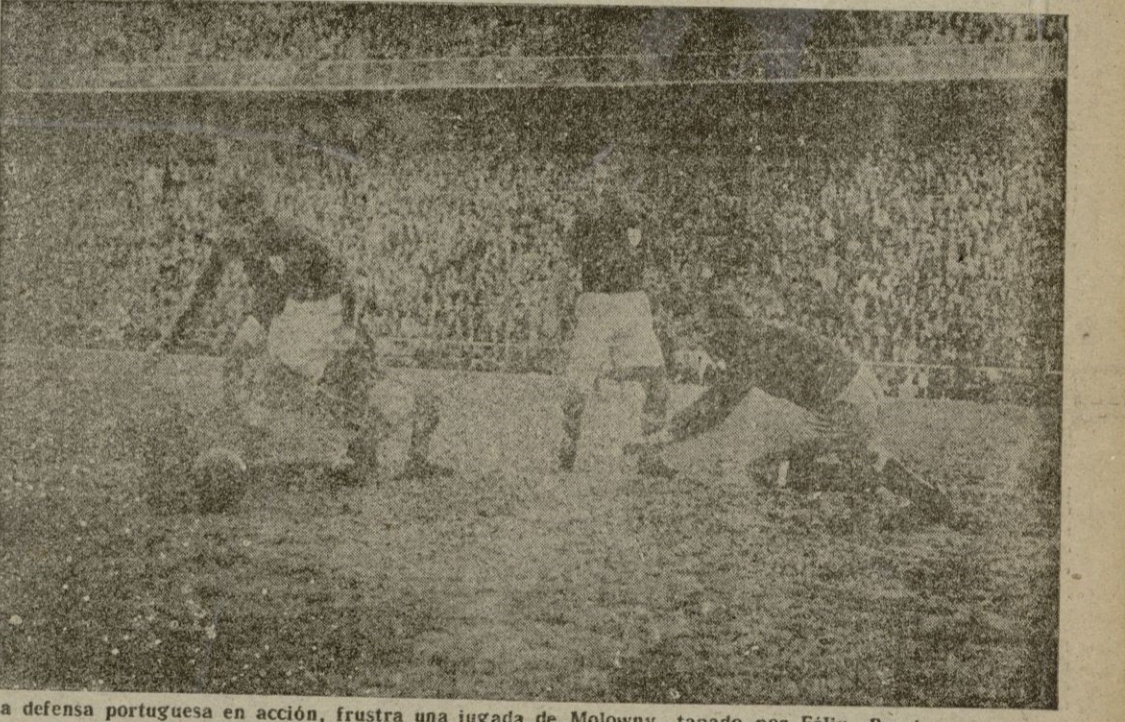
La defensa portuguesa en acción, frustra una jugada de Molowny, tapado por Félix. Barrigana, ya dispuesto a intervenir, pide la pelota a su defensa central.