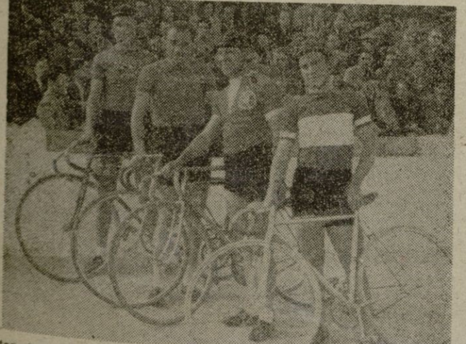
Antes de iniciarse el "match", las dos parejas posan para BALEARES

Repetimos, que nuestras primeras líneas en esta reunión inaugural, sean de felicitación para el V. S. B. y sus dirigentes.