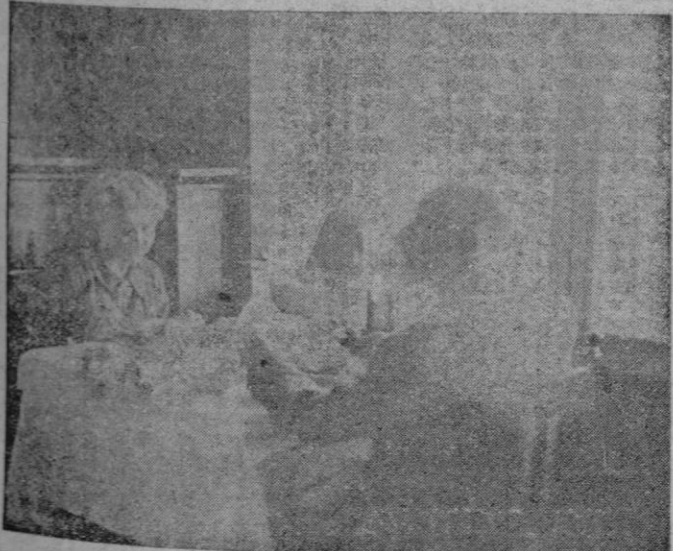
En el magnífico comedor del Hotel Victoria, fué obtenida esta foto de nuestra suscriptora feliz, acompañada de su hermano. En páginas interiores va la narración de la jornada. Que es de aupa, ya verán ustedes