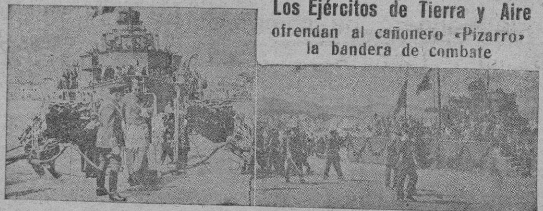
El Excmo. Sr. Obispo al descender del "Pizarro", después de efectuar la bendición de la bandera, costeada por las fuerzas de Tierra y Aire. — Las tropas desfilan ante las autoridades. — (INFORMACION EN PAGINAS INTERIORES)