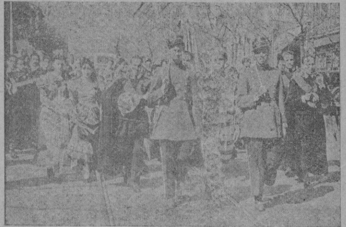
Madrid. — Los estudiantes universitarios madrileños recorrieron las calles de la capital en visita a las autoridades políticas y académicas, en la víspera de la festividad de su santo Patrón Santo Tomás de Aquino, formando una curiosa comitiva con trajes típicos y alegóricos a su actividad.

LOS ESTUDIANTES Y LA FIESTA DE SANTO TOMAS DE AQUINO