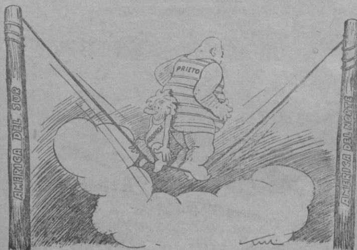
—¡Ay don Inda! ¿A qué mundo iremos a parar ahora?