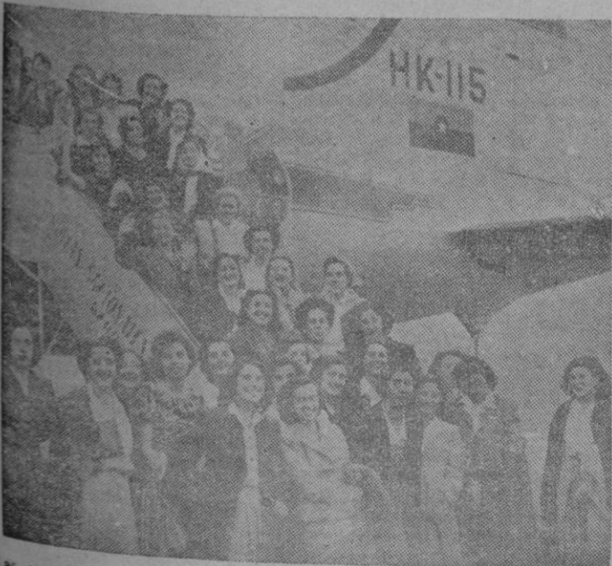
Las camaradas de Coros y Danzas de la Sección Femenina durante uno de sus viajes triunfales por América

El buque venía engalanado con las banderas del código internacional. Ocho remolcadores, también engalanados, se acercaron al «Monte Ayala», llevando a bordo el Ayuntamiento de Santurce, elementos de las cofradías de pescadores, muchachas del Frente de Juventudes y otras personas que acudieron a saludar a los expedicionarios.