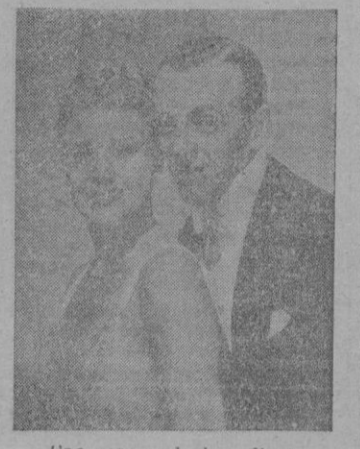
Una escena de la película

Aparte del hecho señalado, poco nuevo cabe destacar en esta obra, en technicolor, que ha sido dirigida por Charles Walters. En "Vuelve a mí" se mantiene la tónica de todas las películas en que tuvieron intervención los dos famosos bailarines: Asunto intrascendente y frívolo, expuesto con fina ironía o comicidad desatada; enorme derroche de elementos interpretativos y técnicos; abundancia de partituras donde tienen cabida desde la música clásica hasta las últimas melodías modernas; y, sobre todo, la presencia de los dos artistas de la danza que, raro caso, son también intérpretes geniales. Con la afluencia de tantos y tan variados recursos nada tiene de particular que "Vuelve a mí" se