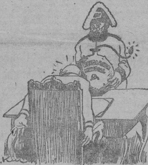
—Estas son mis cartas credenciales.

Paris 16. — El Gobierno ha ordenado a los altos funcionarios oficiales de todo el país, que sofoquen sin piedad cualquier intento comunista de sabotaje o desmoralización de la Nación. Han sido cursadas las órdenes correspondientes después de una reunión extraordinaria del Gabinete celebrada anoche para estudiar la creciente oleada de huelgas de inspiración comunista, que han afectado a Francia, poniéndola de nuevo en primera línea en la guerra fría del Este contra el Oeste. — Efe.