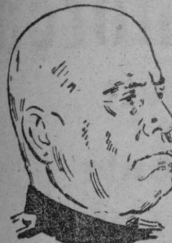
MUSSOLINI su partido fué una reacción antiversallista.

Desde los repartos de territorios hasta las reparaciones (ahora, monstruosamente se acude al desmantelamiento de las fábricas, sin mirarse el número de brazos que quedan sin ocupación), se está siguiendo y ampliándose la huella de Versalles. El resultado lo tenemos previsto. Una mañana cualquiera un «Hombre Nuevo» señalará al Sarre ocupado, a la Prusia mutilada, a los obreros hambrientos sin ocupación, a los héroes sin medallas, a los edificios e instalaciones en ruina. Y lo que volverán a girar —por la falta de perspectiva de unos políticos de tierras de garbanzos— son las aspas del molino de la destrucción, del exterminio y de la guerra.